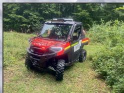
JSDH Prackovice n/L str. 18