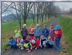
MŠ Brouček str. 14 - 15