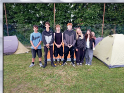
Přivítání prázdnin str. 23